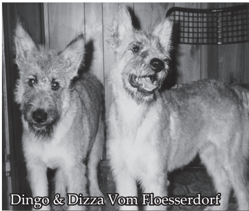
Dingo & Dizza Vom Floesserdorf