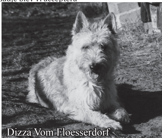
Dizza Vom Floesserdorf

valparna torra och däremellan gick han som en orolig ande i väntans tider. Då alla valparna var födda och lugnet hade lagt sig matade Fedor "sin" Nicole genom att spy upp halvsmält mat åt henne. Efter några veckor hjälptes båda föräld-