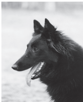
Ovan: Korad SUCH SVCh LP I LP II Fannyhills Olivia d'Equinox. Olivia är den högst meriterade av Valtelina van de Hoge Laer's avkommor och har fört generna vidare genom tre egna kullar.

som har givit oss så mycket. Färden har varit lång och ibland kanske lite krokig men vi är så glada att vi fått vara med om allt vi varit med om. Genom våra "fyrbenta" älsklingar har vi knutit fantastiska kontakter i hela världen, vi har fått kära vänner för livet. Människor som står oss mycket nära i vått och torrt. Dessa människor har med sina stora hundkunskaper meriterat "våra" belgare inom alla bruksgrenar, lydsklasser, korning-