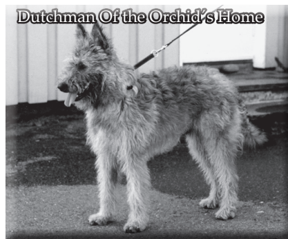
Dutchman Of the Orchid's Home